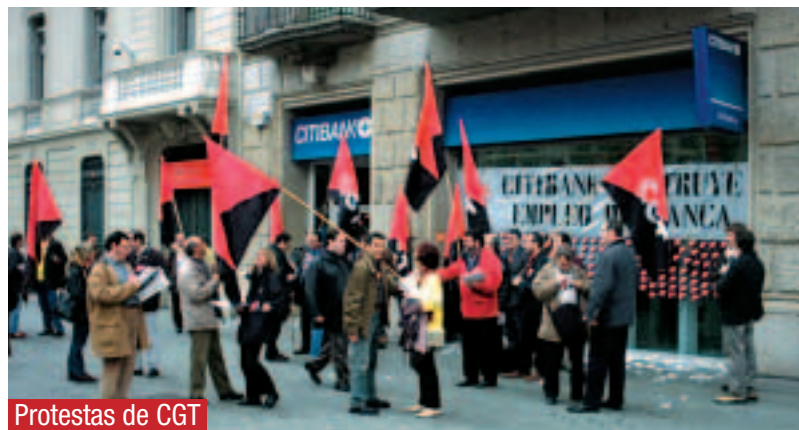
Protestas de CGT

■ Imagen de una protesta de trabajadores de Citibank en Barcelona, descontentos con los acuerdos firmados por la empresa y los sindicatos CCOO, UGT y FITC.